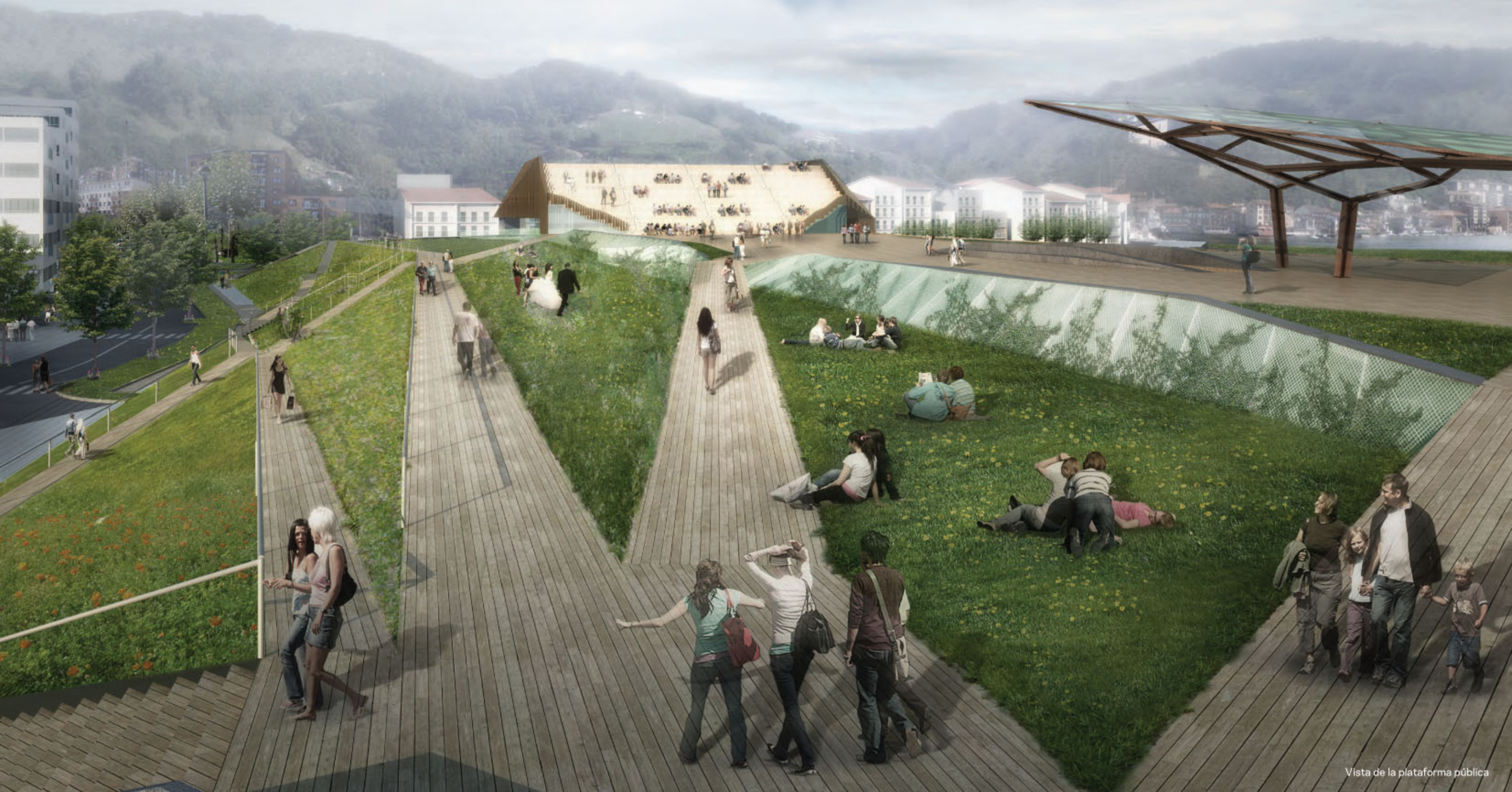
Vista de la plataforma pública