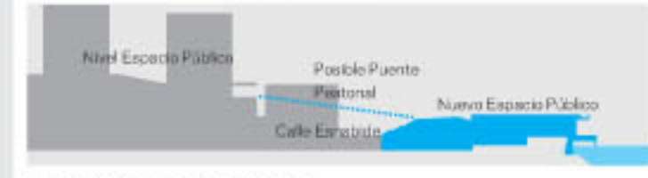
Espacio público elevado +7.20m

de alguna manera se puede convertir en una intensificación del espacio público que ya existe en la población fuertemente determinado por la topografía del monte Ullia. Entender que el espacio público urbano no ha de ser necesariamente un espacio a cota rasante, sino un espacio que tiene cualidades topográficas es ya de por sí una forma de poner en valor algunas de las características fundamentales que forman la identidad del espacio urbano de Pasaia: la topografía.