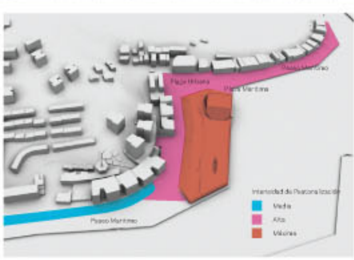
Continuidad Paseo Marítimo