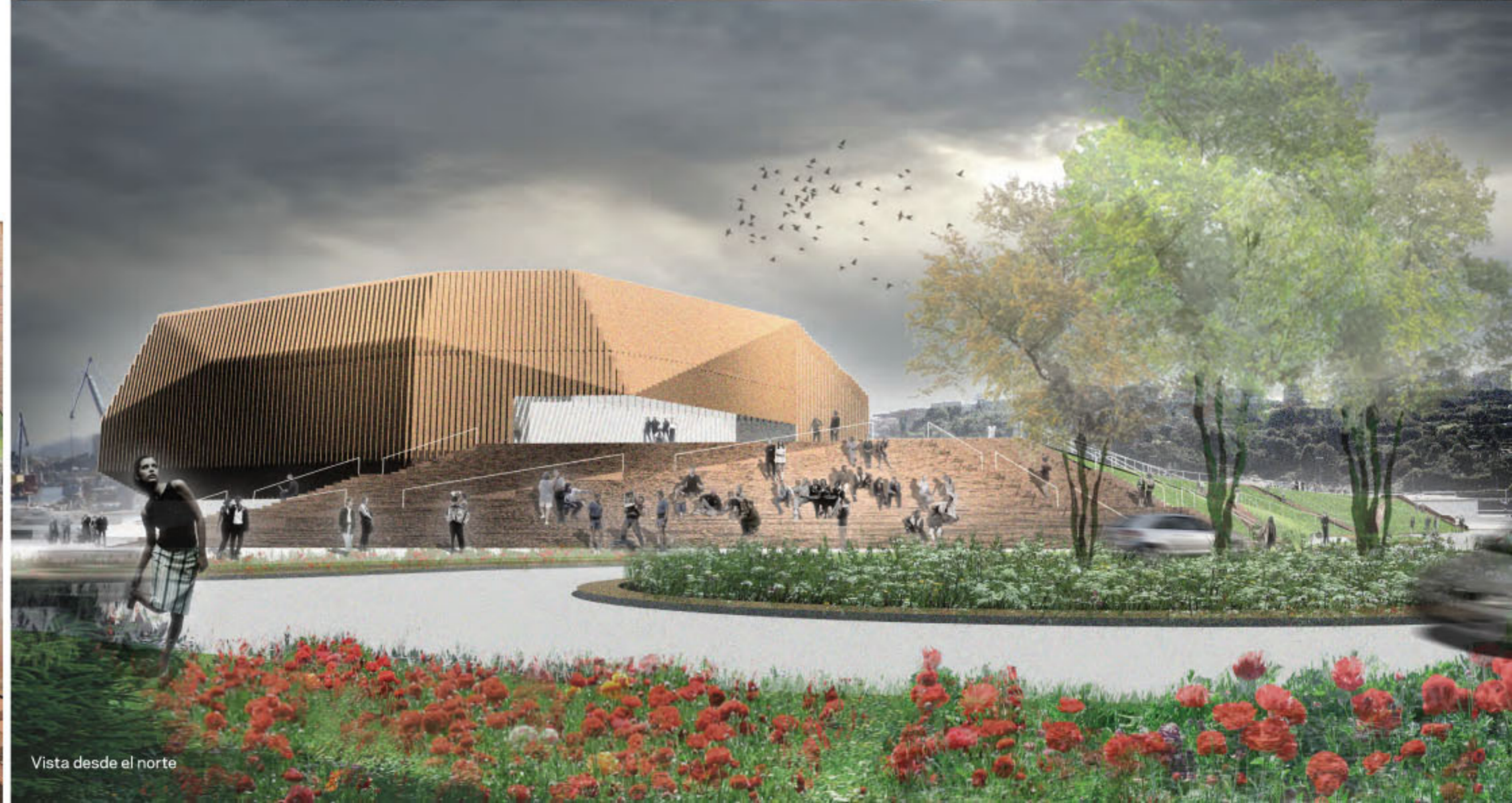
Vista desde el norte