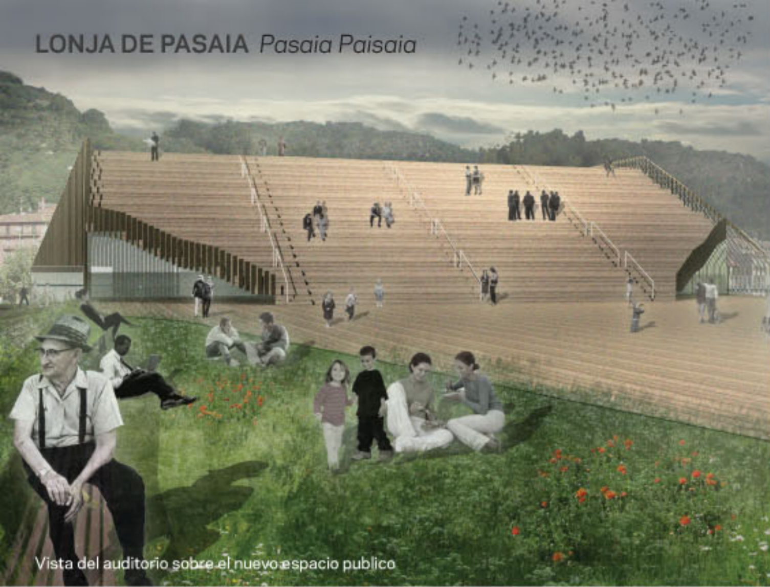
Vista del auditorio sobre el nuevo espacio publico