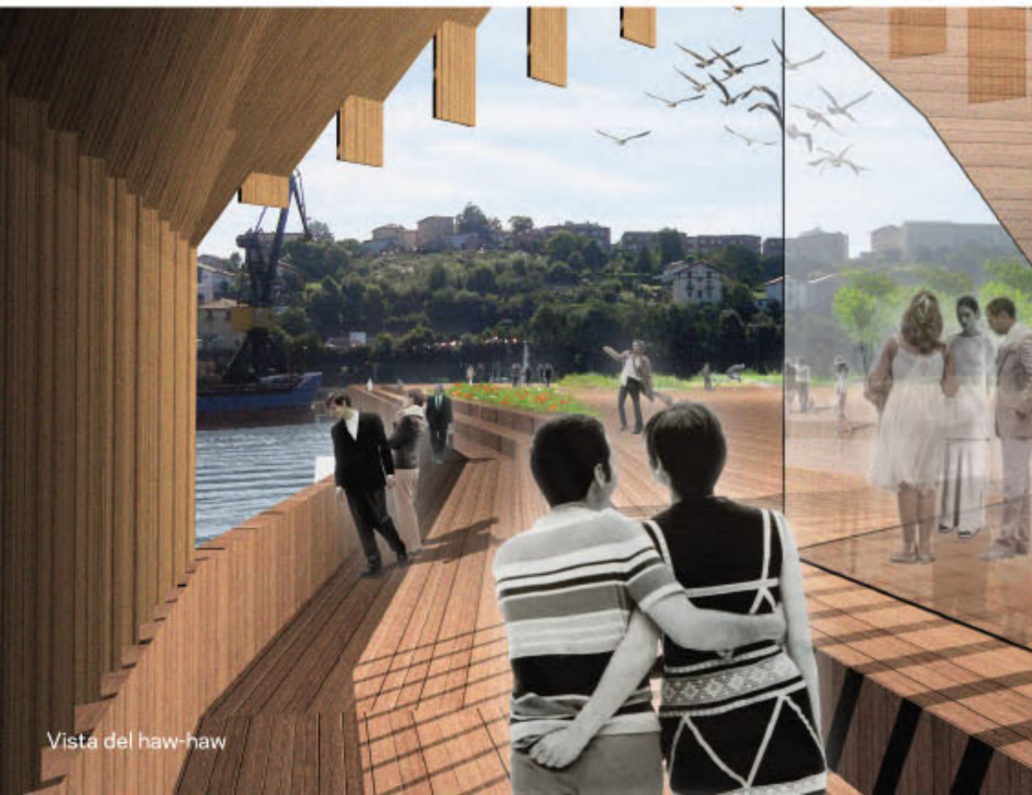
Vista del haw-haw