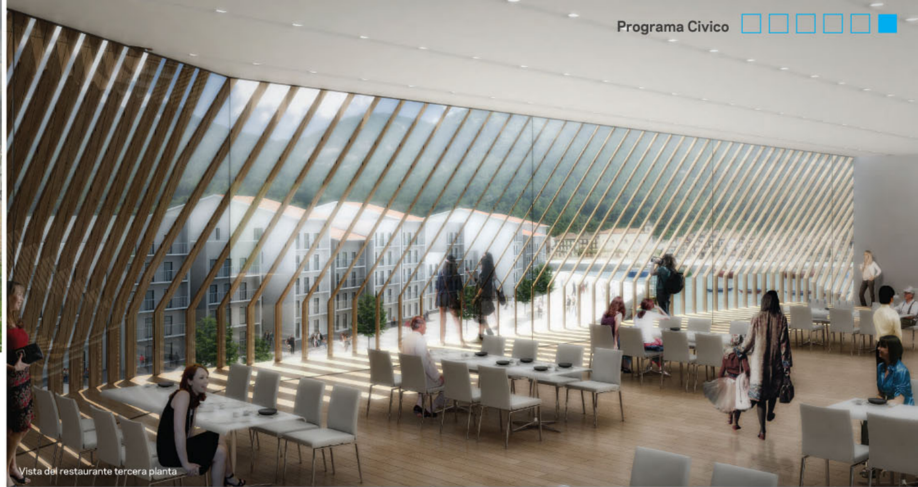
Vista del restaurante tercera planta