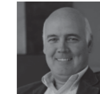
José María Milà www.santacole.com