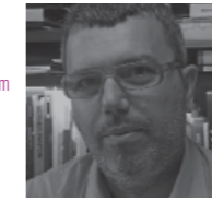
Ignasi Bonjoch www.bonjoch.com