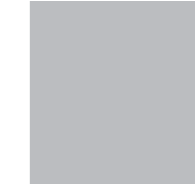
Jorge Fuentes www.estudiofinteriores.com