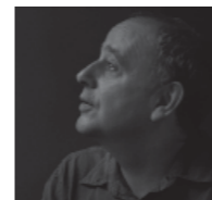
José Luís Mateo www.mateo-maparchitect.com