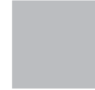
Vicente Nebot www.ocreinteriores.com